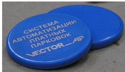
Жетоны Mifare системы VECTOR_AP

Mifare — наиболее распространенная в мире бесконтактная технология смарт-карт, которая базируется на стандарте ISO 14443 Type A 13,56 MHz. Технология была разработана в далеком 1994 году маленькой австрийской компанией Mikron (Mikron FARE-collection System), в настоящее время владельцем технологии является Philips Austria GmbH. Сегодня в мире продано более 500 млн. карт и других носителей этого стандарта (жетоны, брелки, метки и т.п.) и более 5 млн. считывателей.