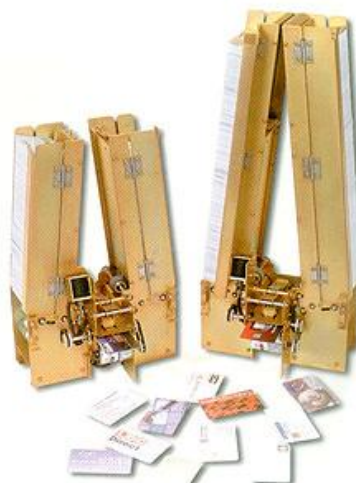
Диспенсеры на 600 и 1000 карт

Диспенсер карт — это весьма сложное изделие точной механики и электроники, требующее квалифицированного периодического обслуживания, чистых карточек и других условий, которые непросто обеспечить в процессе эксплуатации парковки.