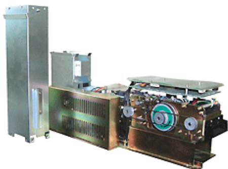
Диспенсер на 500 карт

Устройство выдачи карточек (диспенсер) обычно имеет емкость не более 500 карт, отдельные модели — до 1000 карт.